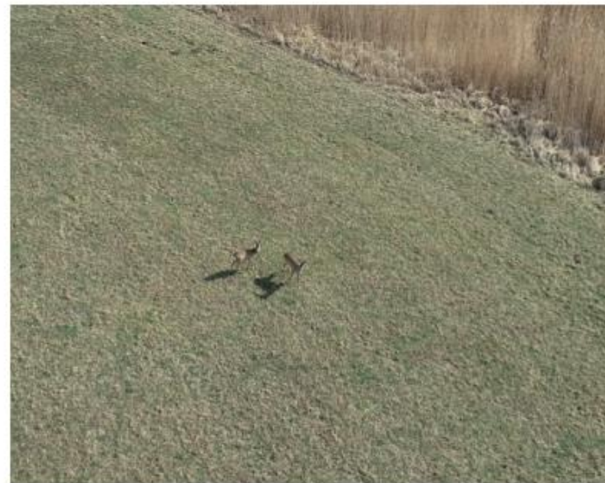
Rys. Sarny na terenie lotniska, uchwycone podczas jednej z kontroli.

Poprawa wydajności i jakości procesu monitorowania stanu elementów infrastruktury