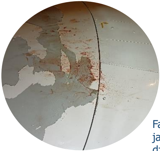
Ślady krwi na osłonie radaru

Do wykonania testu konieczna jest kropla krwi lub świeżo wyrwane pióra. Pióra zgubione przez ptaka nie nadają się do badania. Najlepsze są pióra np.: z upierzenia gardłowo-piersiowego, czy spod skrzydełka, których dudtka zawierają duże ilości DNA