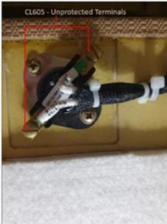
Figure 1: CL605 - Unprotected Terminals

BA has issued recommended service bulletin (SB) 605-21-006, which provides instructions to apply adhesive sealant on the end terminals of the baggage compartment heater thermostat, Part Number 2511L010-1658 (Ident S1001HM), installed on the water system access panel door.