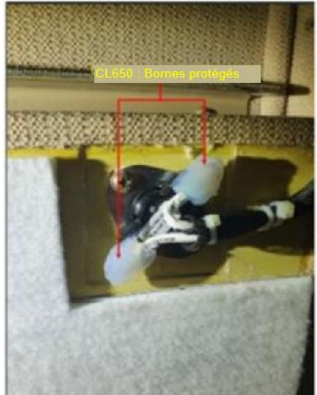
Figure 2 : CL650 – Bornes protégés