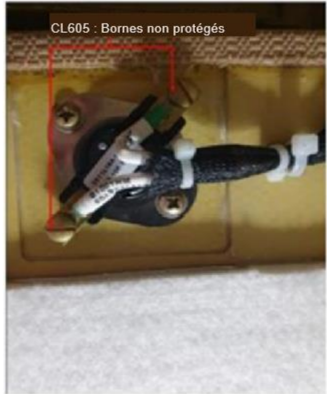
Figure 1 : CL605 – Bornes non protégés

BA a publié le bulletin de service (SB) 605-21-006 recommandé qui fournit les directives à suivre pour appliquer un adhésif d'étanchéité sur les bornes du thermostat de chauffage du compartiment à bagage, référence 2511L010-1658 (ident S1001HM), posé sur la trappe d'accès du circuit d'eau.