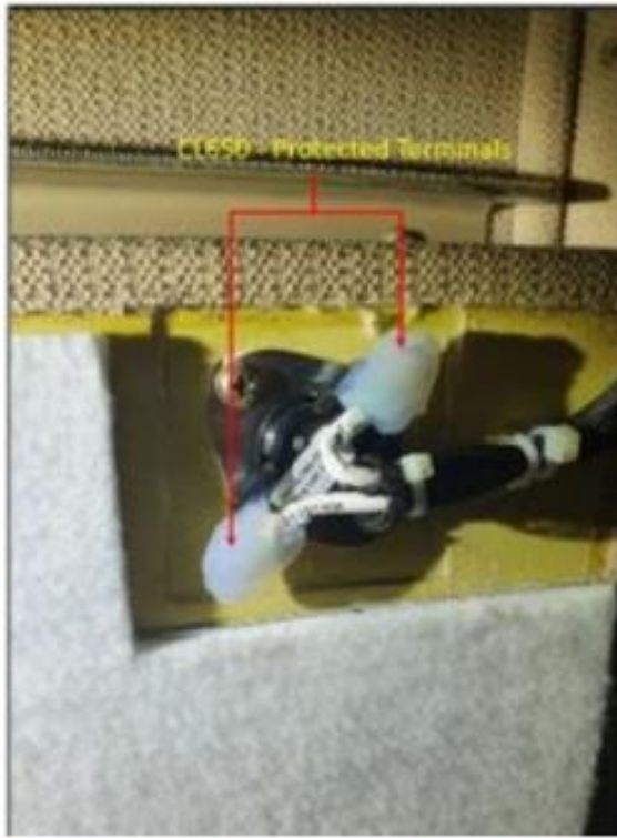
Figure 2: CL650 - Protected Terminals